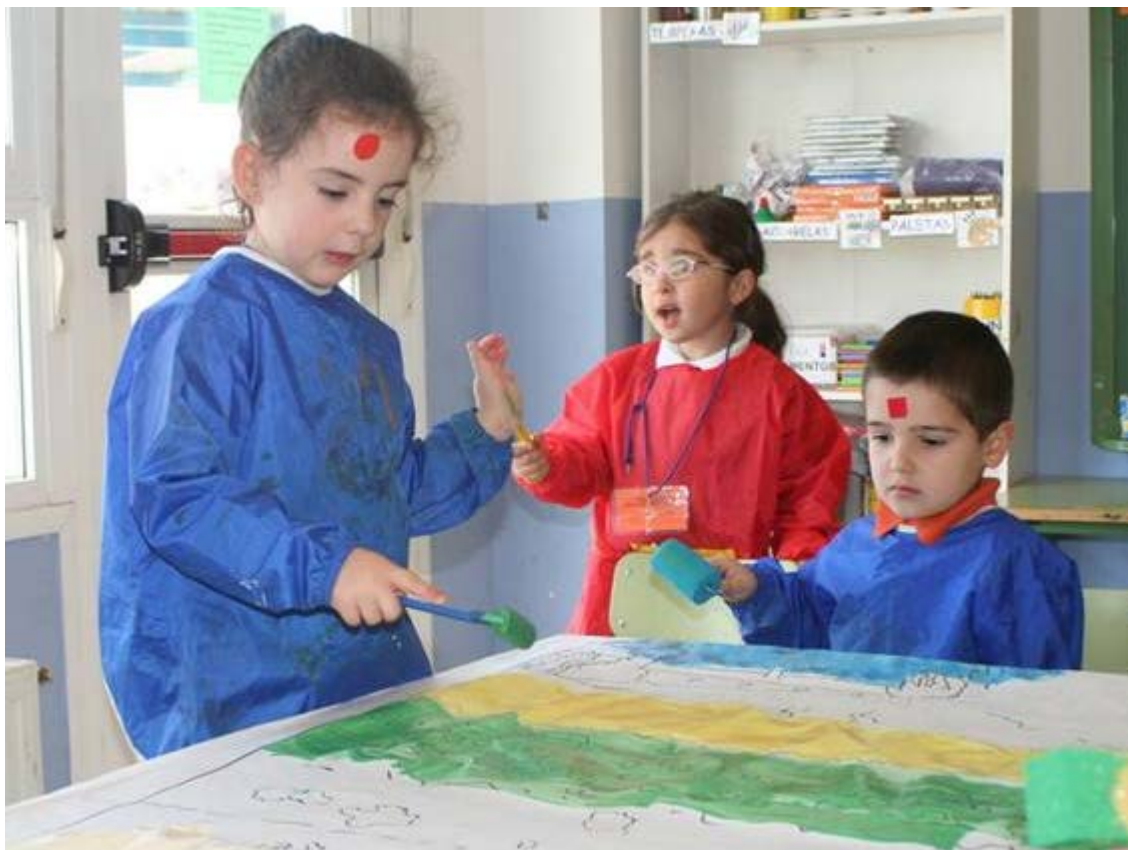
Niños de educación infantil pintando dentro del proyecto “Conociendo a Van Gogh” basado en las pedagogía constructivista.

Se prefieren pedagogías constructivistas o enfoques centrados en el niño, como parte del desarrollo pedagógico para promover la participación de todos los estudiantes.